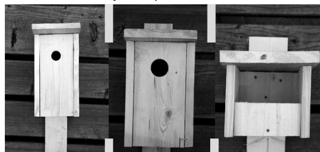
Sýkorník 210,- Kč

1. Ptačí budky - sýkorníky, špačkovníky, rehkovníky - vyrobené v chráněné dílně. Větší množství nutno objednat předem.